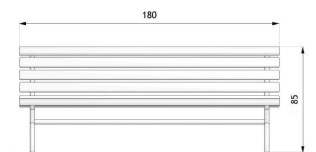
wymiary podane w [cm]